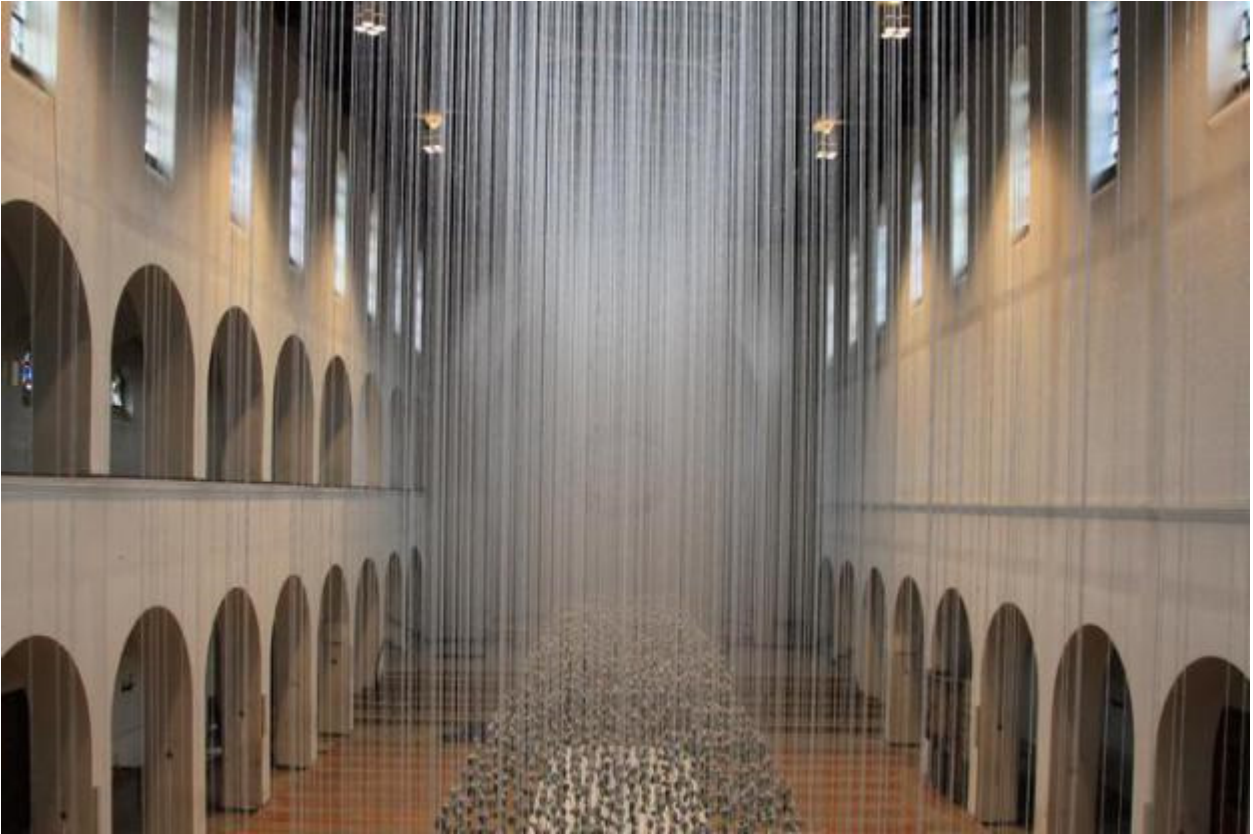
Die Ausstellung in Christ König von Anne Berlit.