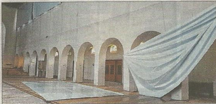
Die Vorbereitungen für die neue Ausstellung in der Kunstkirche laufen auf Hochtouren.